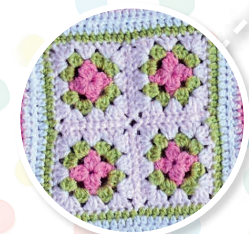
NUMÉRO 5 Le carré Bouquet de roses Raiponce