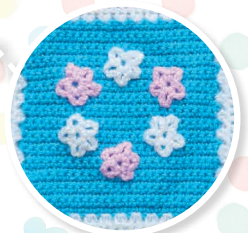
NUMÉRO 2 Le carré Couronne de fleurs de Vaiana