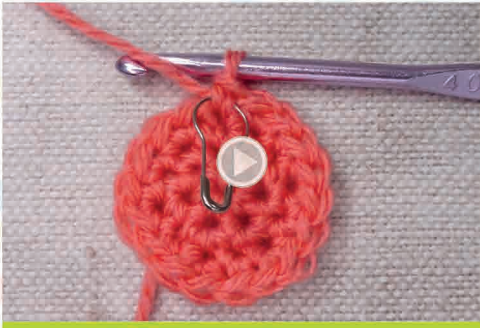
Votre motif à crocheter

De Winnie l'ourson à Cendrillon, de Mickey à Nemo, chaque carré est inspiré d'un personnage Disney pour apporter un peu plus de magie à votre plaid.