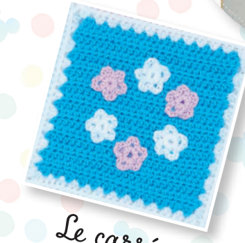
Le carré couronne de fleurs de Vaiana

Avec en plus de superbes idées de projets en crochet + 2 nouvelles pelotes