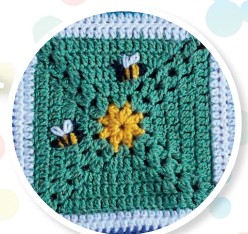
NUMÉRO 4 Le carré Fleur et abeilles Winnie l'ourson