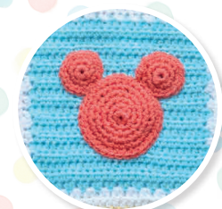
NUMÉRO 1 Le carré Mickey