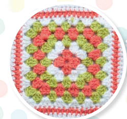
NUMÉRO 3 Le carré Le Livre de la jungle